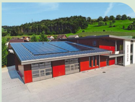
Neubau Wiler Trotte

Weingut Schödler, Villigen www.schoedlerwein.ch