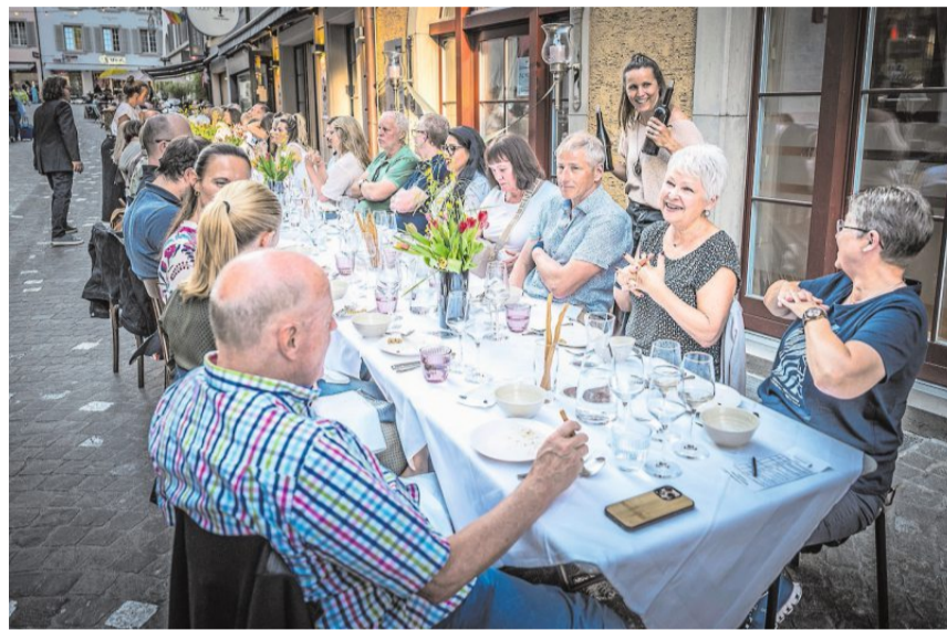
Aargauer Wein gehört zur Feier: In Baden werden dieses Jahr zum zweiten Mal die Weintage mit vielfältigem Programm und der Tavolata angeboten.

Ein besonders sichtbares Beispiel für die Verbindung von Wein und moder-